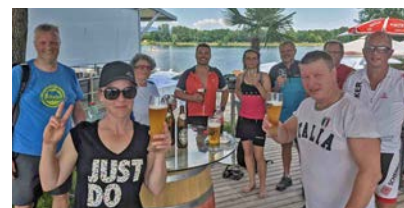
Einkehrschwung der hitzebeständigen „Tischtennis-Radfahrer“ in Feldkirchen beim Radausflug 2021.

Bei großer Hitze fuhren wir mit der Mühlkreisbahn nach Rohrbach-Berg und mit den Rädern bergab zur Donau und über Aschach - Feldkirchen zurück nach Ottensheim. Auch einige Einkehrschwünge gehören zur geselligen Tradition. Den Abschluss der Radtour feierten wir mit einem Abendessen im Donauhof Ottensheim.