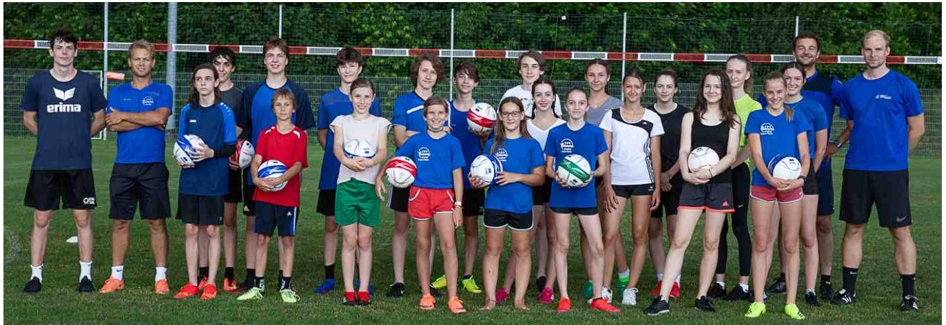
Nach der Coronapause wurde das gemeinsame Faustballtraining mit voller Begeisterung wieder gestartet.