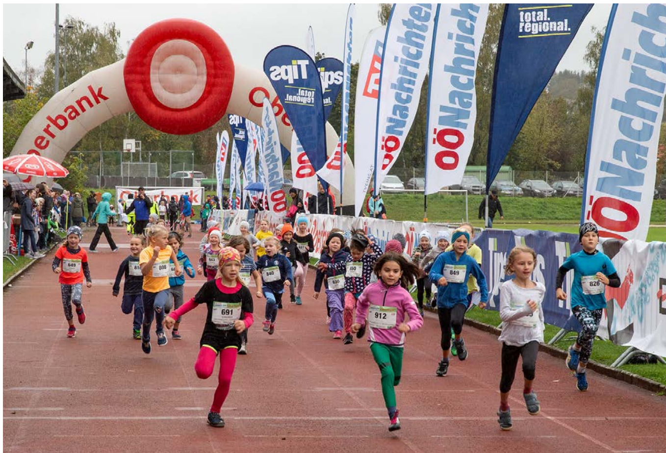
Start-Foto beim Kindermarathon 2019

Nach einem Jahr Corona-Pause wird beim Oberbank-DONAULAUF 2021 heuer wieder der Kindermarathon einer der Höhepunkte.