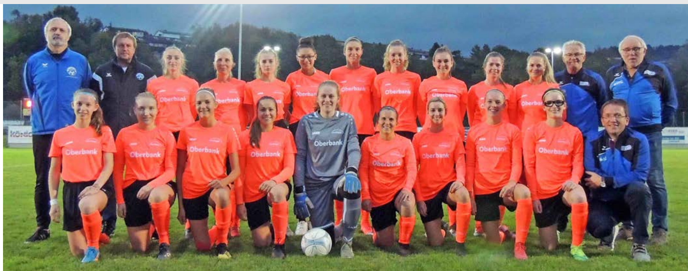
Das Team TSV Ottensheim Ladies beendete als Tabellenführer die Landesliga OÖ 2020/21