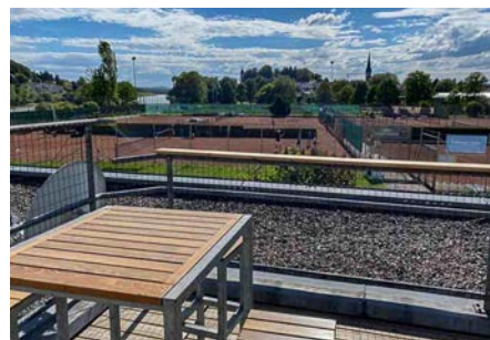
Ausblick von der neuen Terrasse auf die Tennisanlage