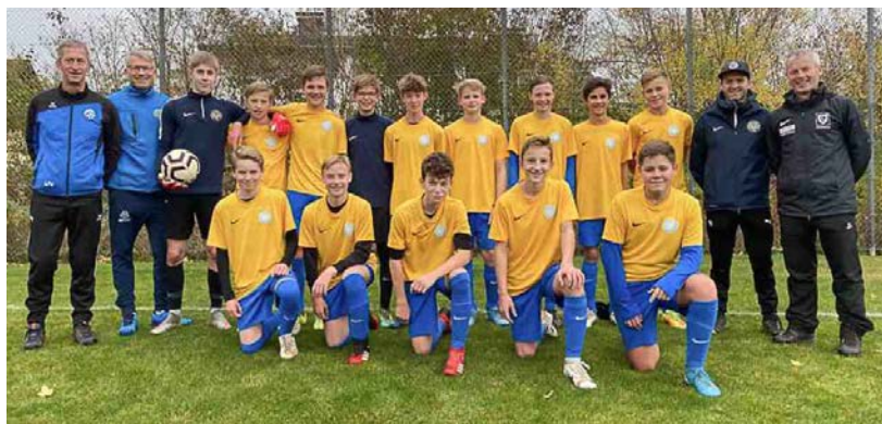
Mannschaft und Betreuerteam SPG U15 St.Martin/Kleinzell/Ottensheim