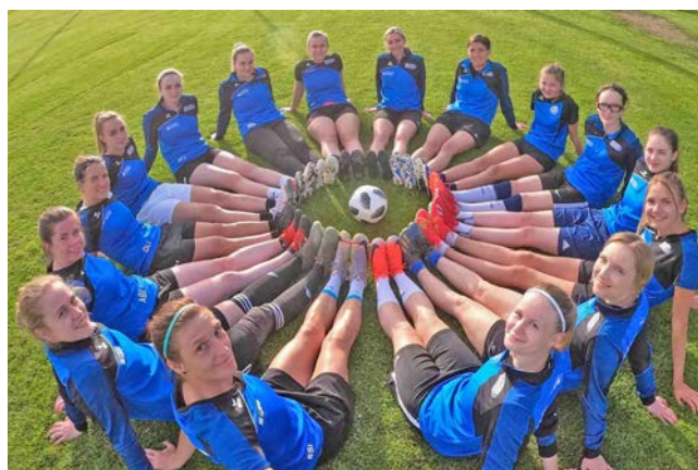
Ein starkes Team für den Frauenfußball und Ottensheim – die TSV Ottensheim Ladies