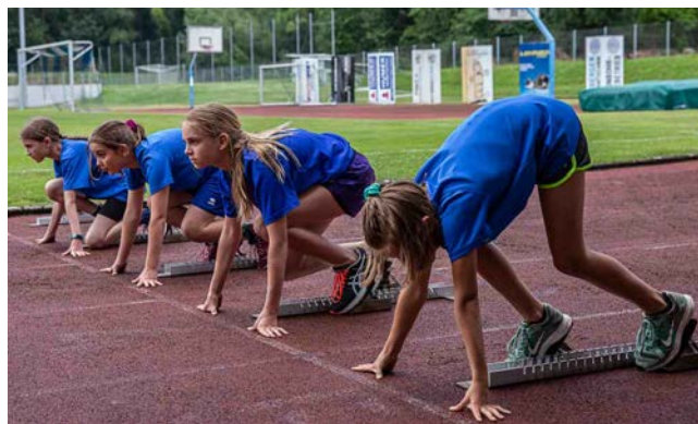
Startübungen sind für den Sprint besonders wichtig