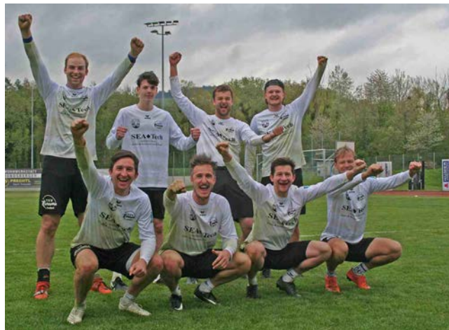
Unsere Bundesligamannschaft kämpft ab Herbst um den Klassenerhalt in der obersten Spielklasse.

Das heißt für den Herbst, dass man gegen den Abstieg kämpft, dort zählt dann jeder gespielte Ball doppelt. Gegen die Teams aus Bozen, Münzbach und Kremsmünster spielt man in einem Abstiegsturnier jeder gegen jeden.