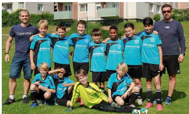
Mannschaft und Betreuerteam U12

Nach einer langen COVID-bedingten Spiel- und Trainingspause freuten sich die Kinder wieder Mitte März auf den Trainingsbeginn. Die Mannschaft hat sich in der Zeit kaum verändert – der Kern der U12