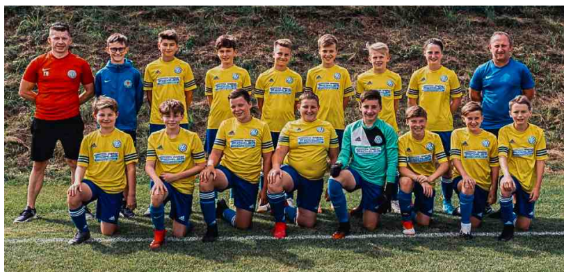
Mannschaft und Betreuerteam SPG U14 St.Martin/Kleinzell/Ottensheim