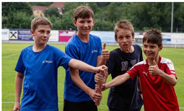
Bei der Staffel wird Leichtathletik zur Mannschaftssportart