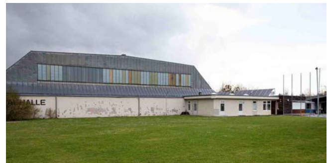
Im Außenbereich der Donauhalle wäre Platz für eine Bogensportanlage

Wir planen, unser Sportangebot mit der Möglichkeit zum Bogenschießen im Bereich der Außenfläche zwischen Donauhalle und Stadion zu erweitern. Dazu ist die Aufstellung eines Containers und die Montage eines Pfeilfangnetzes entlang der Donauhallenaußenwand notwendig. Sobald uns die notwendige Genehmigung durch die Marktgemeinde Ottensheim vorliegt, werden wir mit der Umsetzung dieses Projektes starten.