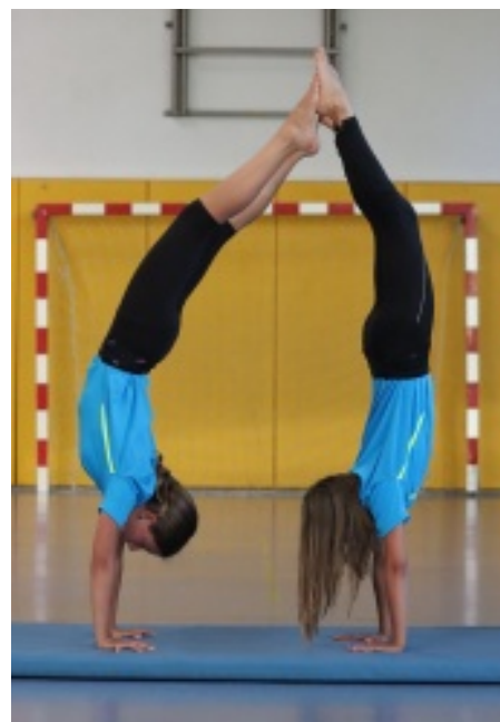
Die Gerätturngruppe ist mit Eifer bei der Sache. Der Handstand gelingt schon perfekt!