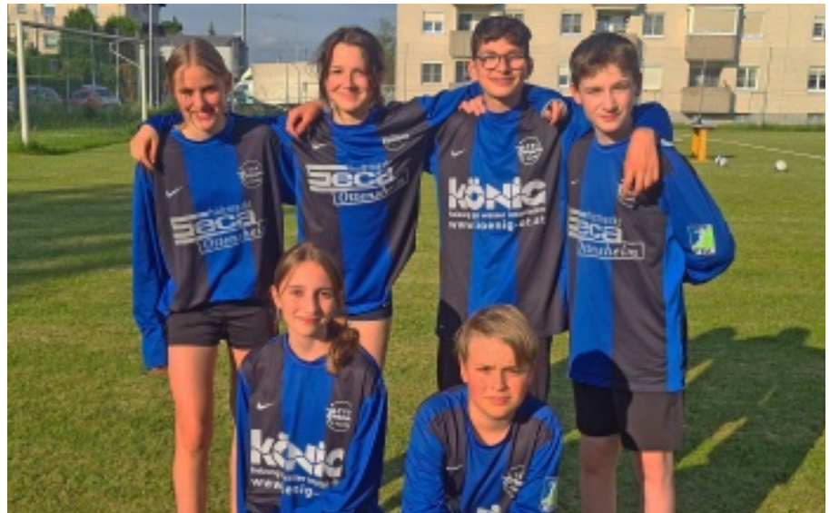
Nachwuchsarbeit hat in der Sektion Faustball einen hohen Stellenwert