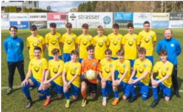
SPG U15 holt den Meistertitel