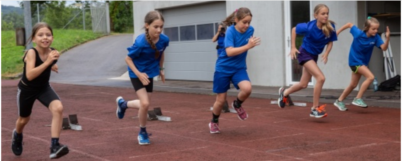
Leichtathletik Start Mädchen