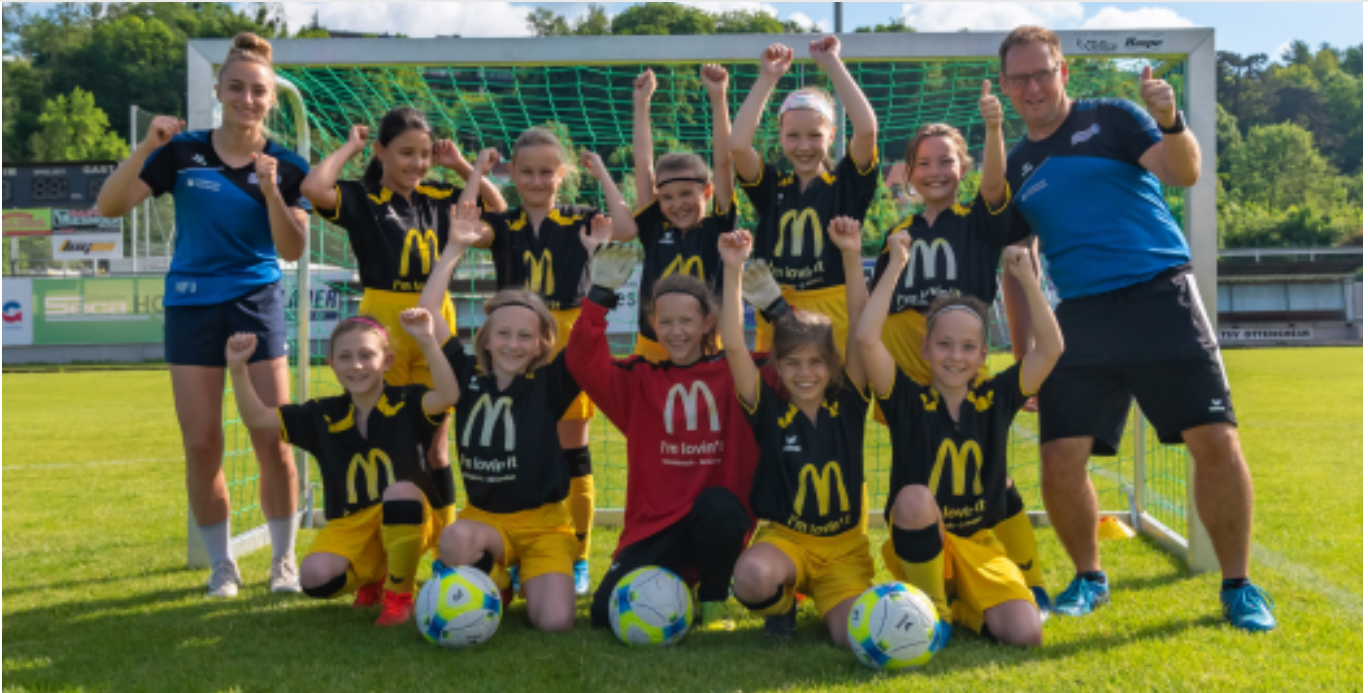
Große Begeisterung bei unseren Fußballmädchen