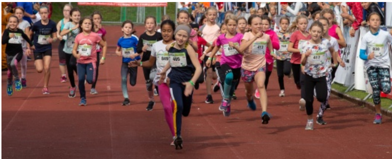
Start beim Kindermarathon 2021

Das 31. Schüler DONAU Leichtathletik Meeting konnte heuer wieder durchgeführt werden. Die Bewerbe 60 m Lauf, Weitsprung, Vortex-Wurf und 300 bzw. 600 m Hindernislauf wurden ausgetragen. Ergebnisse lagen zu Redaktionsschluss noch nicht vor.