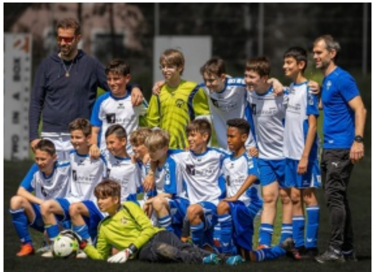
U13 kämpft um den Meistertitel